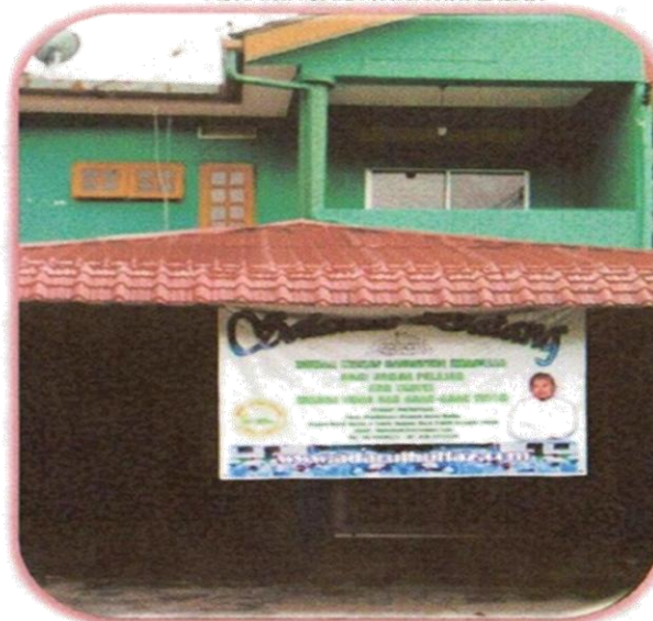
ASRAMA SAIDATINA KHADIJAH

HARGA RUMAH : RM 135,000 SUMBANGAN/WAKAF : RM 35,000 BAKI (PINJAMAN) : RM 100,000