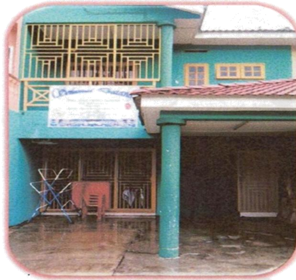
ASRAMA SAIDATINA MAIMUNAH

HARGA RUMAH : RM 150,000 SUMBANGAN/WAKAF : RM 35,000 BAKI (PINJAMAN) : RM 115,000